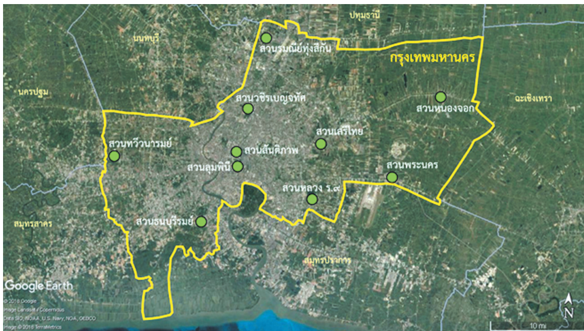
ภาพที่ 2 ตำแหน่งของสวนสาธารณะทั้ง 10 แห่ง ในกรุงเทพมหานคร