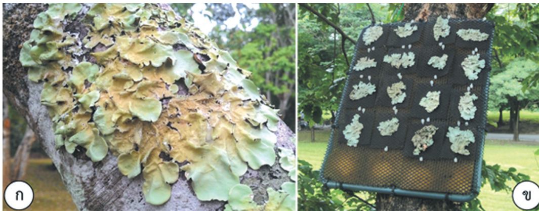
ภาพที่ 1 ก) ลักษณะของไลเคนชนิด Parmotrema tinctorum และ ข) การวางตัวอย่างไลเคนในพื้นที่ตรวจวัด

กรุงเทพมหานครมีเนื้อที่รวม 1,569 ตารางกิโลเมตร มีประชากร 5,682,415 คน (ณ วันที่ 31 ธันวาคม 2560, กรมการปกครอง) เมื่อรวมประชาชนที่เข้ามาศึกษาและทำงานมีมากกว่า 10 ล้านคน มีสวนสาธารณะ 37 แห่ง (ณ วันที่ 30 เมษายน 2561, สำนักสวนสาธารณะ) ปัญหามลพิษทางอากาศในกรุงเทพมหานครมีสาเหตุหลักมาจากการจราจรของรถยนต์ซึ่งมีมากถึง 9,778,661 คัน (ณ วันที่ 31 ธันวาคม 2560, กรมขนส่งทางบก) และปัจจุบันมีสถานีตรวจวัดคุณภาพอากาศทั้งหมด 18 สถานี (ณ วันที่ 30 เมษายน 2561, กรมควบคุมมลพิษ)