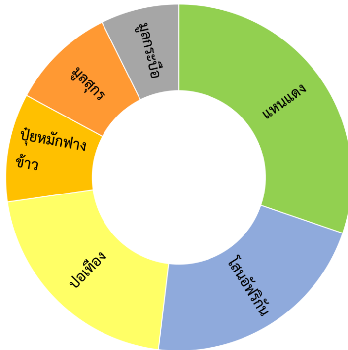
รูปที่ 3 เปรียบเทียบความแตกต่างของปริมาณไนโตรเจนในปุ๋ยอินทรีย์

ระยะเวลาสั้น ขนาดพื้นที่เล็ก และต้นทุนต่ำกว่าการปลูกพืชปุ๋ยสดประมาณ 45-50 วัน ก่อนไถกลบเป็นปุ๋ยพืชสด หรือการเลี้ยงสัตว์เพื่อผลิตปุ๋ยคอก จากคุณสมบัติของແหนແດງที่กล่าวมานี้ ทำให้ແหนແດງกลายเป็นอีกทางเลือกหนึ่งที่มีศักยภาพเป็นแหล่งไนโตรเจนสำหรับการปลูกผัก โดยเฉพาะผักที่ปลูกด้วยระบบเกษตรอินทรีย์ ที่ไม่ใช้ปุ๋ยเคมีในกระบวนการผลิต