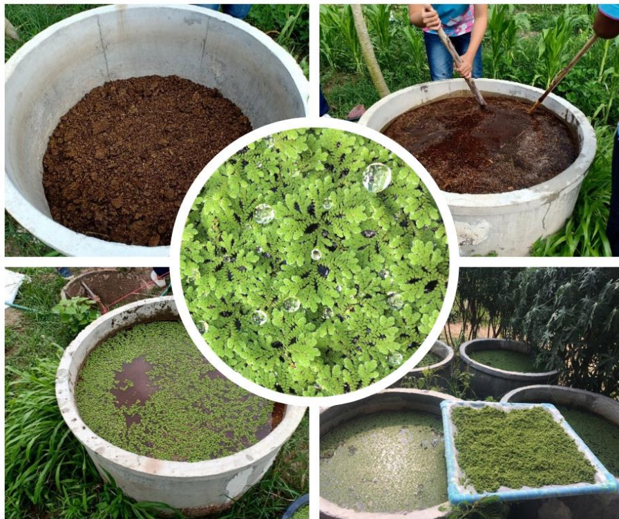
รูปที่ 2 การขยายพันธุ์แหนแดงในบ่อซีเมนต์