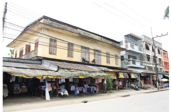
รูปภาพที่ 1 การใช้ประโยชน์ที่ดินของเมืองเชียงใหม่ในปัจจุบัน