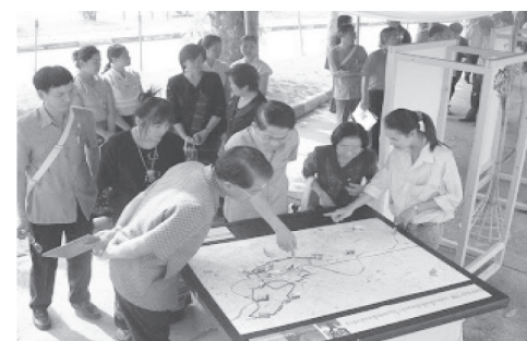
รูปภาพที่ 5 การปรับรูปแบบความคิดด้านการอนุรักษ์เมือง (Urban Conservation) เสริมสร้างความรู้ความเข้าใจให้แก่ประชาชนในพื้นที่ และจัดเวทีชี้แจงรูปแบบผังเมืองที่สอดคล้องกับการอนุรักษ์เมืองประวัติศาสตร์เชียงใหม่ โดยนักศึกษาศาสนาปัตยกรรมศาสตร์ มหาวิทยาลัยราชภัฏเชียงราย