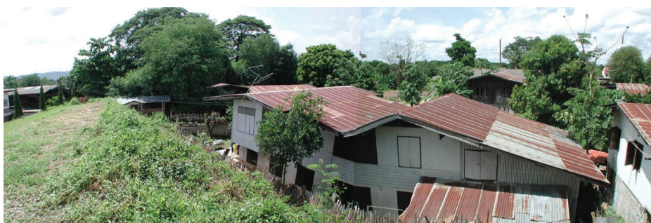
รูปภาพที่ 3 การตั้งถิ่นฐานบริเวณรอบนอกแนวเขตกำแพงเมืองเก่า มีการบุกรุกและถมคุน้ำเพื่อใช้เป็นที่อยู่อาศัยและทำเกษตรกรรม

โบราณสถานที่ถูกรुकกล้าเหล่านี้อยู่ในสภาพพังทลายเป็นเนิน ส่วนใหญ่ถูกทิ้งให้อยู่ในสภาพทรุดโทรม บางแห่งถูกบุกรุกเพื่อปลูกสร้างบ้านเรือนและทำพื้นที่เกษตรกรรม (รูปภาพที่ 3) เมื่อเปรียบเทียบกับภาพถ่ายดาวเทียมการใช้ประโยชน์ที่ดินของเมืองเชียงใหม่ ในปี พ.ศ. 2554 พบ การใช้ประโยชน์ที่ดินประเภทที่อยู่อาศัยในตัวเมืองเชียงใหม่กระจายตัวในพื้นที่โดยรอบซึ่งมีสัดส่วนที่เพิ่มขึ้น การใช้ประโยชน์ที่ดินพื้นที่ดินประเภทพาณิชยกรรมหรือย่านการค้า ซึ่งกระจายตัวตามแนวถนนพหลโยธินและถนนริมโขงมีการขยายตัวเพิ่มขึ้น เนื่องจากนโยบายส่งเสริมการลงทุนการค้าชายแดนของภาคการค้าและบริการและการท่องเที่ยวของภาครัฐและหน่วยงานในท้องถิ่น