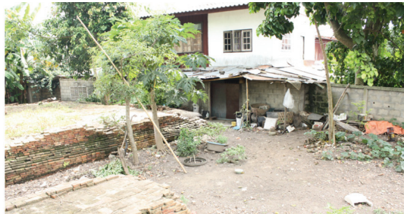
รูปภาพที่ 2 สิ่งปลูกสร้างติดกับแหล่งโบราณสถานและบ้านพักอาศัยต่อเติมรुकกล้าเข้าไปในแนวเขตโบราณสถาน เกิดมลทัศน์ทางทัศนียภาพของเมืองทางประวัติศาสตร์และเสี่ยงต่อการพังทลายของโบราณสถาน

โบราณสถานที่ถูกรुकกล้าเหล่านี้อยู่ในสภาพพังทลายเป็นเนิน ส่วนใหญ่ถูกทิ้งให้อยู่ในสภาพทรุดโทรม บางแห่งถูกบุกรุกเพื่อปลูกสร้างบ้านเรือนและทำพื้นที่เกษตรกรรม (รูปภาพที่ 3) เมื่อเปรียบเทียบกับภาพถ่ายดาวเทียมการใช้ประโยชน์ที่ดินของเมืองเชียงใหม่ ในปี พ.ศ. 2554 พบ การใช้ประโยชน์ที่ดินประเภทที่อยู่อาศัยในตัวเมืองเชียงใหม่กระจายตัวในพื้นที่โดยรอบซึ่งมีสัดส่วนที่เพิ่มขึ้น การใช้ประโยชน์ที่ดินพื้นที่ดินประเภทพาณิชยกรรมหรือย่านการค้า ซึ่งกระจายตัวตามแนวถนนพหลโยธินและถนนริมโขงมีการขยายตัวเพิ่มขึ้น เนื่องจากนโยบายส่งเสริมการลงทุนการค้าชายแดนของภาคการค้าและบริการและการท่องเที่ยวของภาครัฐและหน่วยงานในท้องถิ่น