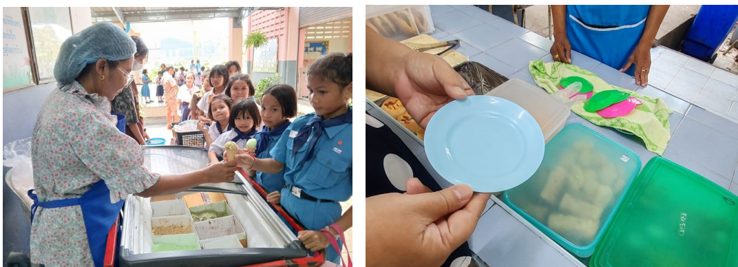
รูปที่ 2 ตัวอย่างผลลัพธ์จากการที่มีข้อตกลงกับพื้นที่เช่า โดยการให้แม่ค้าตัดไอศกรีมลดบรรจุภัณฑ์ และร้านขนมใส่กล่องพร้อมขายและใส่จานส่งเสริมการใช้ซ้ำในพื้นที่เช่า

ผู้บริหาร เป็นผู้มีบทบาทสำคัญเป็นอย่างมากในการผลักดันนโยบายจนถึงการติดตามตรวจสอบ ซึ่งต้องเริ่มจากการกำหนดนโยบายและแผนงาน วางแผนการจัดการขยะ สร้างแผนการแยกขยะอย่างชัดเจน กำหนดบทบาทหน้าที่ มอบหมายหน้าที่ให้คณะครู นักเรียน และบุคลากรในโรงเรียนรับผิดชอบตามความเหมาะสม สร้างระบบการจัดการขยะ และจัดสรรงบประมาณที่สอดคล้องกับระบบที่สามารถทำได้จริง เช่น ถังขยะ เครื่องชั่ง และอุปกรณ์อื่นๆ อีกทั้งยังต้องมีการติดตามและประเมินผล ตรวจสอบระบบประเมินประสิทธิภาพของการจัดการขยะในโรงเรียนเป็นประจำ ใช้ข้อมูลปริมาณขยะที่ลดลง ที่ได้รวบรวมมาจากคณะทำงานนำเสนอและชี้แจงต่อกับผู้ปกครองและชุมชน ให้เกิดความเข้าใจและความร่วมมือไปในทิศทางเดียวกัน และเชื่อมโยงกับองค์กรหรือหน่วยงานที่เกี่ยวข้องที่เกิดกระบวนการถ่ายทอดความรู้หรือแลกเปลี่ยนความรู้ สร้างกลไกการจัดซื้อจัดจ้างสีเขียว (รูปที่ 2) เช่น การทำความเข้าใจกับพื้นที่เช่า การใช้บรรจุภัณฑ์ของแม่ค้า การเลือกสินค้าเพื่อวางขายในสหกรณ์ ขอความร่วมมือพ่อค้าหน้าโรงเรียน เป็นต้น