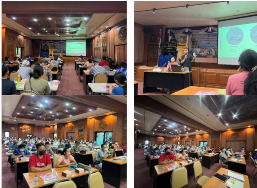
รูปที่ 4 การอบรมให้ความรู้เกี่ยวกับการคัดแยกประเภทขยะและบรรจุภัณฑ์ทดแทนพลาสติก การเรียนรู้การลดพลาสติกใช้ครั้งเดียวทิ้ง จากร้านค้าที่เข้าร่วมกิจกรรม

การจัดกิจกรรม Green Lucky ดำเนินการระหว่าง เดือน สิงหาคม - กันยายน 2566 ทุกวัน ศุกร์ เสาร์ และอาทิตย์ เป็นจำนวนทั้งสิ้น 12 วัน ณ ถนนคนเดินกาดช่วงเมืองน่าน โดยในช่วงก่อนเริ่มกิจกรรม (ระยะที่ 1) มีร้านค้าที่สนใจเข้าร่วมกิจกรรมทั้งสิ้น 44 ร้านค้า (ข้อมูลวันที่ 18 สิงหาคม 2567) ที่ผ่านการอบรมการเลือกใช้บรรจุภัณฑ์พลาสติกที่สามารถนำมาขายได้จากโครงการ ฯ ได้รับความร่วมมือจากเทศบาลเมืองน่าน และผู้ประกอบการร้านรับซื้อขยะรีไซเคิล ในพื้นที่จังหวัดน่าน (รูปที่ 4) โดยร้านค้าที่เข้าร่วมโครงการ มีแนวทางในการเลือกใช้บรรจุภัณฑ์พลาสติกที่สามารถขายได้ และมาตรการการลดการใช้พลาสติกใช้ครั้งเดียวทิ้ง (Single Used Plastic) ดังแสดงใน รูปที่ 5