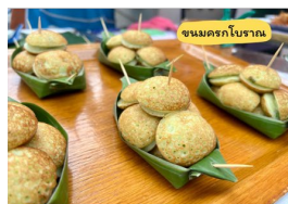
เปลี่ยนเป็นใบตอง/ชานอ้อย