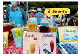
มาตรการ แจก หลอด ฝา หุ้หุ้ม ถุง เฉพาะที่ลูกค้าขอ