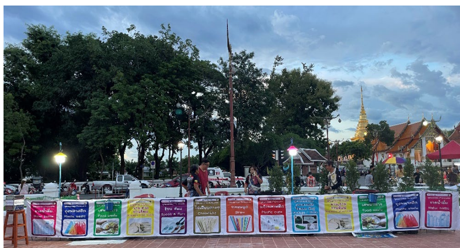
รูปที่ 3 บริเวณกิจกรรมการคัดแยกขยะ ร่วมกับ เจ้าหน้าที่ อปพร. เทศบาลเมืองน่าน